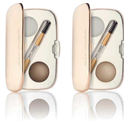
ブルネット ブロード 落ち着いた髪色の方に 明るめの髪色の方に

透明なワックスとアイブロウパウダーが入ったキット。ワックスで毛流れを整えてからパウダーで眉を描けば、理想のシェイプを長時間キープ。専用ブラシが付属。