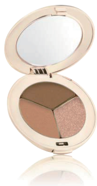
ピュアプレストアイシャドウ トリプル 2.8g ¥4,600(税抜)

高品質の微粒子ミネラルをベースにつくられたプレストタイプのアイシャドウは、繊細な輝きと美しい発色が魅力。さらに美容効果が高いピクノジェノールやザクロエキスを高配合。乾燥など悩みの多い目元をしっかり保湿します。