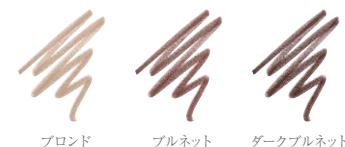
ブロード ブルネット ダークブルネット

繰り出し式の固めのなめらかな描き心地で、細い線も思いのまま。プリティブロウキットとあわせて使用すれば、パーフェクトな眉が仕上がります。