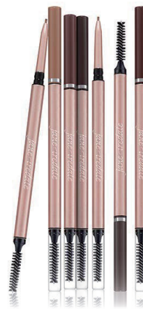
リトラクタブルブロウペンシル 0.09g ¥2,500(税抜)

繰り出し式の固めのなめらかな描き心地で、細い線も思いのまま。プリティブロウキットとあわせて使用すれば、パーフェクトな眉が仕上がります。